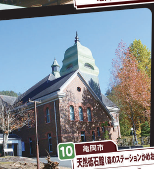
10 亀岡市 天然砥石蔵(道の駅かめおか) 千代川ICから3km