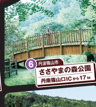
6 丹波篠山市 ささやまの森公園 丹南篠山ICから17km