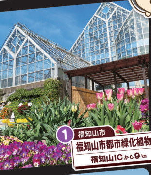
1 福知山市 福知山市都市緑化植物園 福知山ICから9km