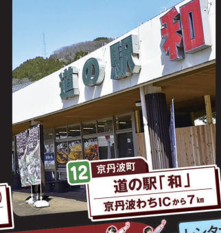
12 京丹波町 道の駅「和」 京丹波わちICから7km