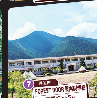
7 丹波市 FOREST DOOR 旧神楽小学校 青垣ICから5km