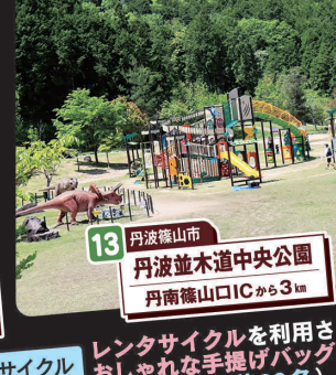
13 丹波篠山市 丹波並木道中央公園 丹南篠山ICから3km