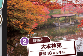
2 綾部市 大本神苑 綾部ICから4km