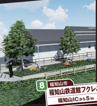
8 福知山市 福知山鉄道館フレクル 福知山ICから5km