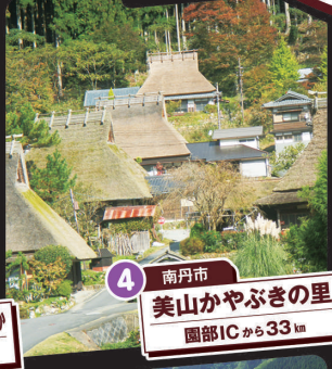
4 南丹市 美山かやぶきの里 園部ICから33km