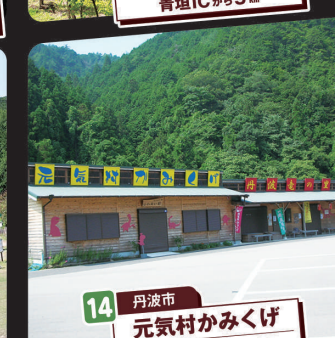
14 丹波市 元気村かみくげ 丹南篠山ICから11km