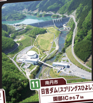
11 南丹市 日吉ダム(スプリングスひよし) 園部ICから7km