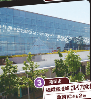
3 亀岡市 生涯学習施設・道の駅 ガレリアかめおか 亀岡ICから2km