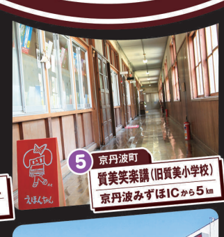
5 京丹波町 質美笑楽講(旧質美小学校) 京丹波みずほICから5km