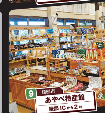
9 綾部市 あやべ特産館 綾部ICから2km