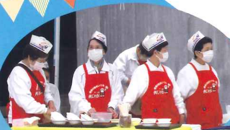
発祥の地 京都まいづる