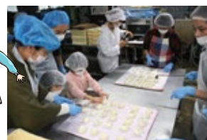
和菓子作り体験の様子