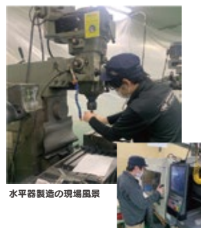
水平器製造の現場風景