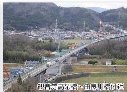
観音寺高架橋～由良川橋付近